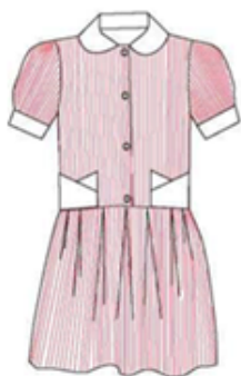
Платье в полоску Велосипедки белые Колготки белые Носки/гольфы белые