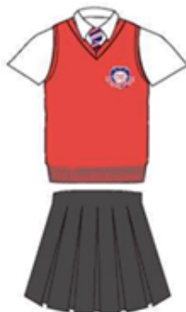
Рубашка белая с коротким рукавом, галстук Безрукавка, кардиган, юбка серая Колготки серые/велосипедки серые Носки серые