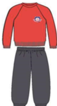
Толстовка Спортивные брюки Носки белые Обувь: белые кроссовки