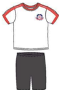
Футболка Шорты спортивные Носки белые Обувь: белые кроссовки